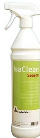
ISA CLEAN SEASON