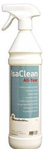
ISA CLEAN ALL YEAR