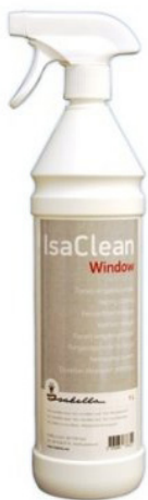
ISA CLEAN WINDOW

-Förtält ska också tvättas och torkas innan det packas ihop inför nästa säsong. Isabella har bra produkter för detta som finns att köpa hos oss. Undvik att vecka fönster och packa inte ihop förrän det är hel torrt. Märk upp pinnarna för enklare montering till nästa säsong.